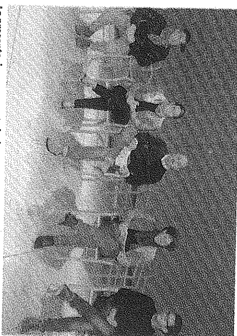
La presentazione avvenuta ieri